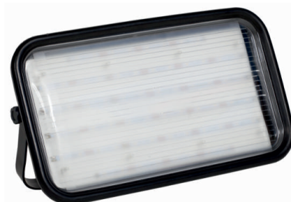
Magnum SMD LED 32W